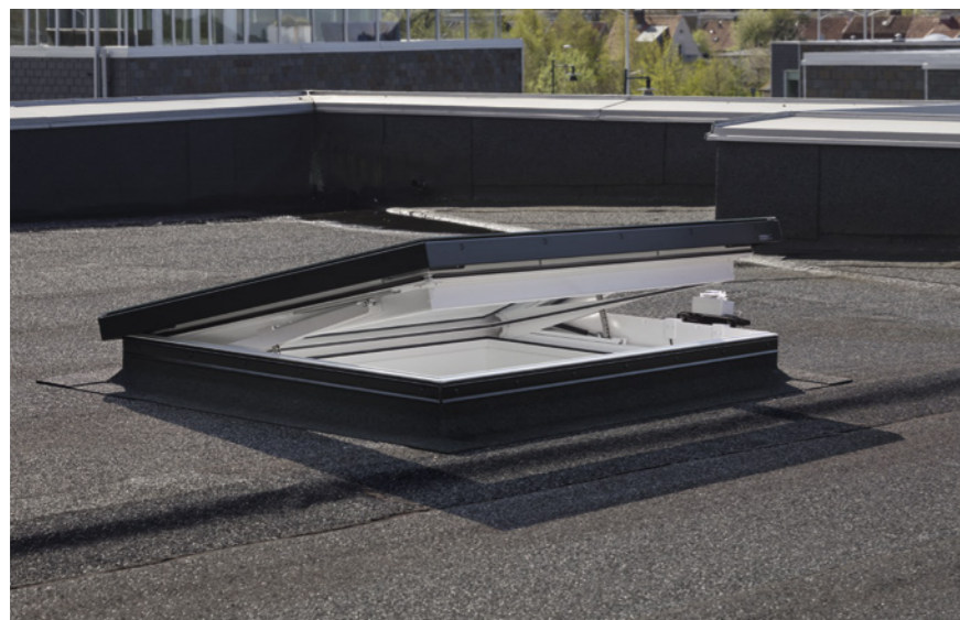
Funzione di ventilazione

Il comando viene effettuato con l'interruttore a muro integrato nell'interruttore a chiave. E il sensore di pioggia chiude automaticamente la finestra quando inizia a piovere.