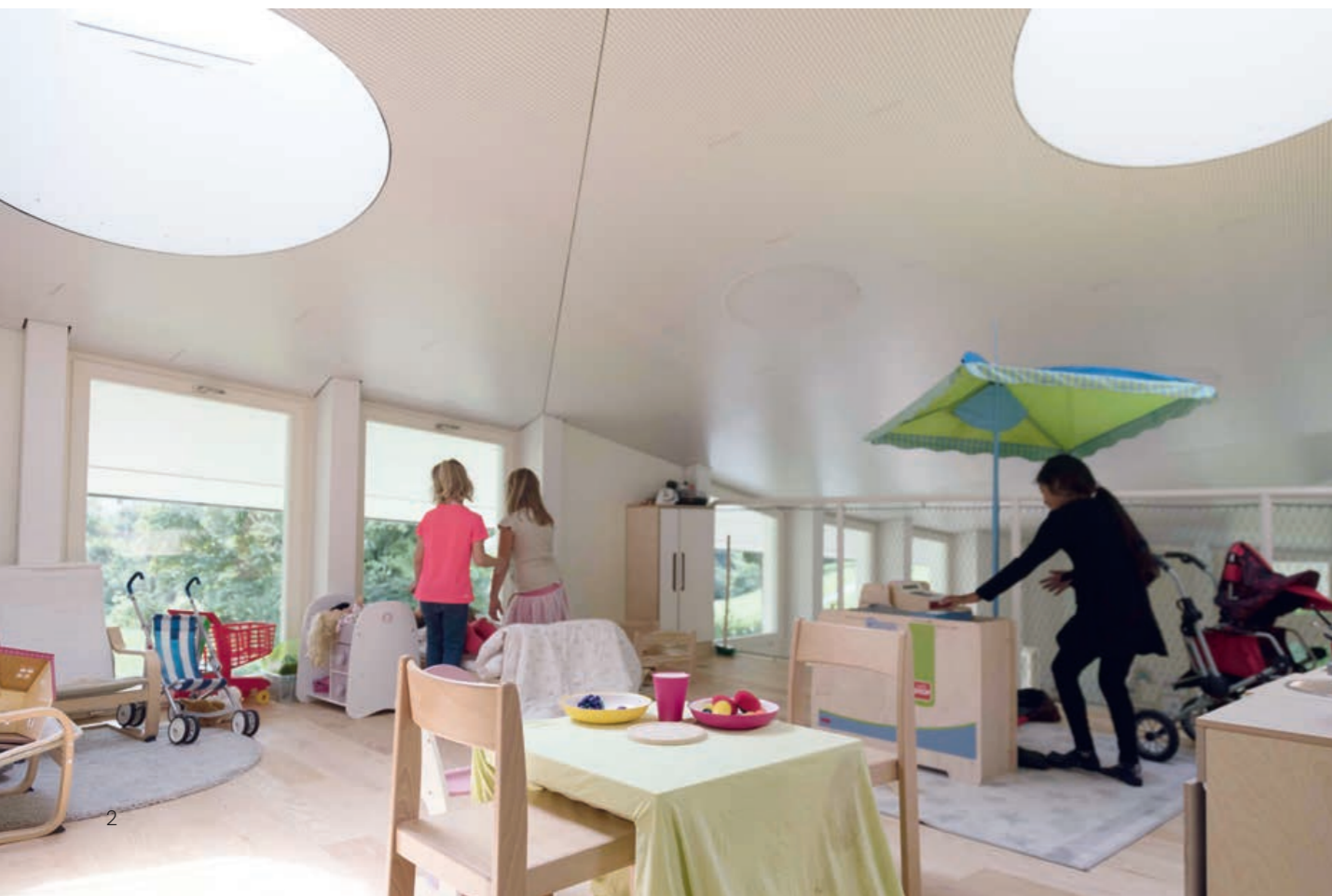
Architekt: Meik Nigg Architects, Foto: Kasia Jackowska